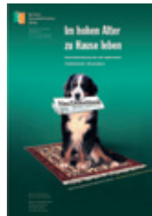
2006 Im hohen Alter zu Hause leben