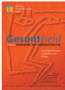
2002 Qualitätsoffensive in Medizin und Pflege