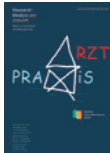
2004 Hausarztmedizin der Zukunft – Wege zur innovativen Versorgungspraxis